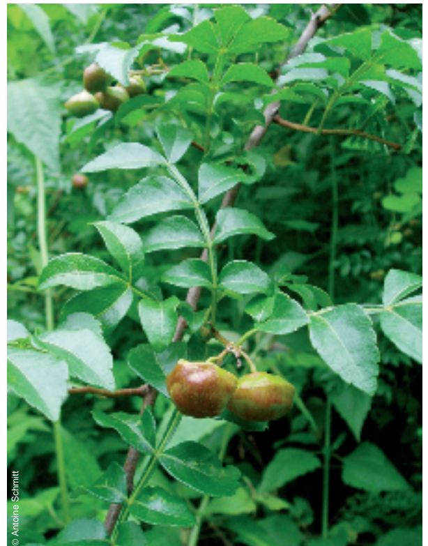
Harrissionia perforata (Blanco) Merr. (photo de droite)