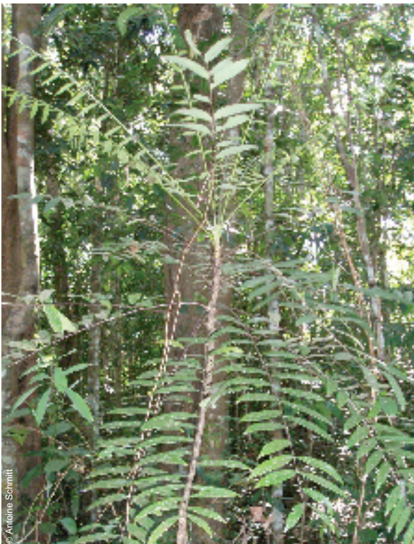
Eurycoma longifolia (photo de gauche)

La plupart du temps, ces plantes sont bues après décoction. Certaines sont connues pour être sujettes à des résistances à cause d'un usage trop fréquent (ex. Cyperus rotundus ). D'après la littérature, une large partie de ces plantes ont soit montré une