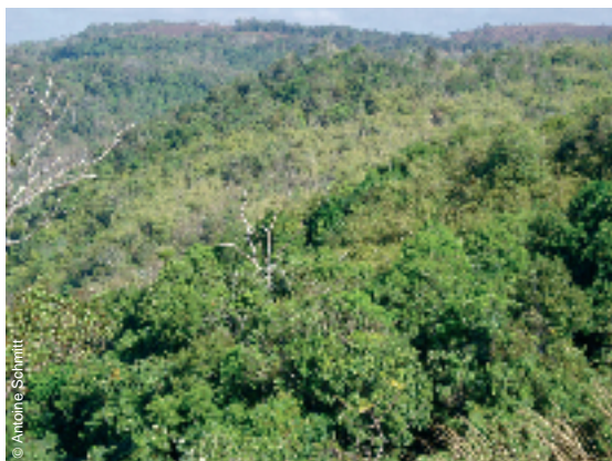
Forêt dense des contreforts du Plateau, aux environs du village de Pu Trom

Comme dans d'autres parties du monde (Utarini et al., 2003), la population possède une bonne connaissance des symptômes, alors que l'origine de la transmission du paludisme reste floue, caractérisée par une multiplicité de causes. Dans cette étude, la première cause correspond aux moustiques. Les autres font référence au vent et au soleil, à la pluie, à l'eau et la nourriture mauvaise 11 , et plus rarement aux esprits. Le plus souvent ces causes ne s'excluent pas ; environ 75% des personnes interrogées mentionnent à la fois les moustiques et au moins un des trois éléments naturels (soleil, vent ou pluie). Les esprits n'ont été mis en cause que très rarement (à l'exception de fortes fièvres chez les enfants en bas âge) alors qu'ils le sont largement pour d'autres maladies. Des études antérieures (avant la mise en place des programmes d'éducation à la santé) ont montré chez la même population une fréquence nettement plus élevée des causes spirituelles, notamment en relation avec les tremblements (Pordié, 1998 ; Guyant, 1998).